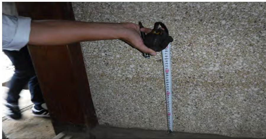
・ 向山秋元地区床上浸水②