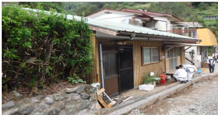
・ 向山秋元地区床上浸水①