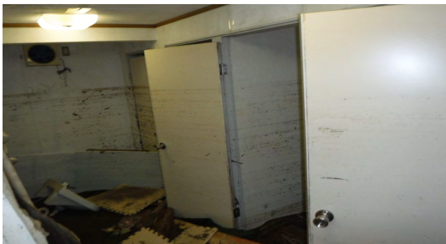
・ 押方地区床下浸水