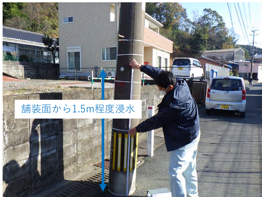
富美山地区の被災状況