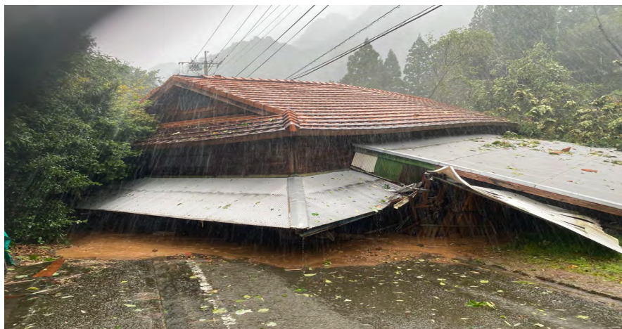
・ 岩戸地区牛舎倒壊